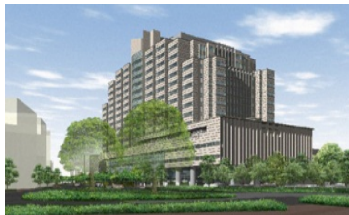
戸山地区 (東京都新宿区)

対象組織 国立国際医療研究センター 戸山地区 (センター病院等) 国府台地区 (国府台病院等) 清瀬地区 (国立看護大学校)