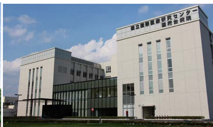
国府台地区 (千葉県市川市)