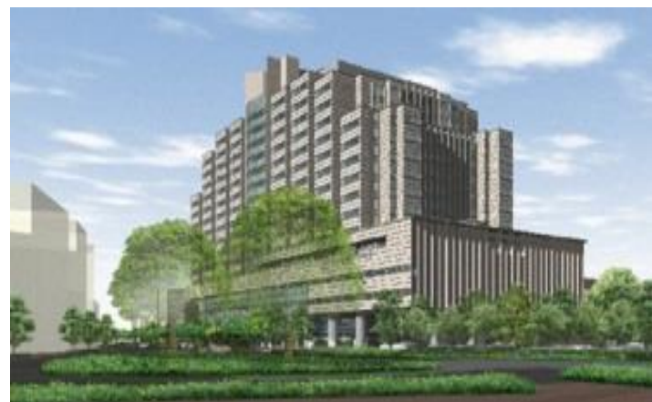
戸山地区 (東京都新宿区)

対象組織 国立国際医療研究センター 戸山地区 (センター病院等) 国府台地区 (国府台病院等) 清瀬地区 (国立看護大学校)