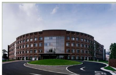
清瀬地区（東京都清瀬市）