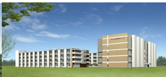
国府台地区（千葉県市川市）