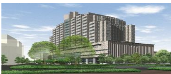
戸山地区（東京都新宿区）

具体的には、新興・再興感染症及びエイズ等の感染症、糖尿病・代謝性疾患、肝炎・免疫疾患ならびに国際保健医療協力を重点分野とし、我が国のみならず国際保健の向上に寄与するため、主要な診療科を網羅した総合的な医療提供体制の下で、国際水準の医療を創出・展開し、チーム医療を前提とした全人的な高度専門・総合医療の実践及び均てん化ならびに疾病の克服を目指す研究開発を推進する所存です。